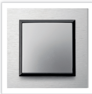
ŁP-1V/18 – IMPRESJA – łącznik jednobiegunowy w kolorze srebrnym z ramką szczotkowane aluminium. Zalety: połączenie funkcjonalności z elegancką linią, umożliwiające zastosowanie produktów zarówno w nowoczesnych jak i klasycznych aranżacjach.