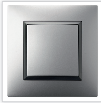
ŁP-1U/18 – ARIA – łącznik jednobiegunowy w kolorze srebrnym z ramką ozdobną w kolorze czarnym. Zalety: elegancki, metalizowany osprzęt, który sprawdzi się w każdym wnętrzu. Ramki ozdobne pozwolą na wprowadzenie delikatnych akcentów kolorystycznych.