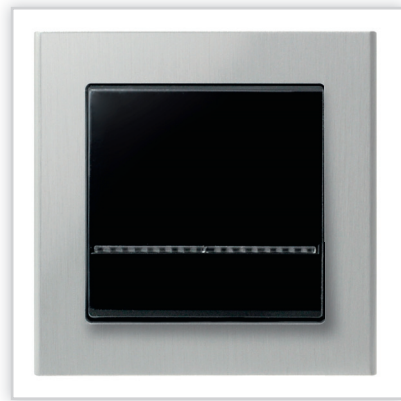
ŁP-1RS/33 – SONATA – łącznik jednobiegunowy z podświetleniem w kolorze czarny metalik z ramką aluminiową. Zalety: idealna kompozycja do wnętrza nowoczesnych.