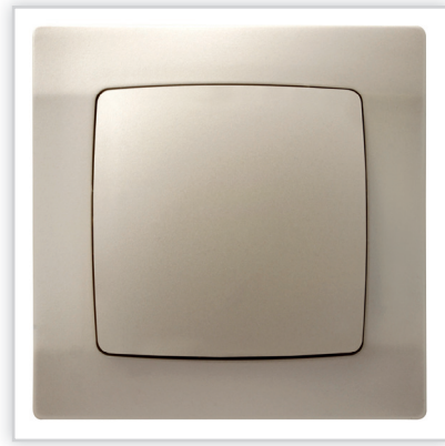
ŁP-1S/42 – KARO – łącznik jednobiegunowy w kolorze ecru perłowy. Zalety: idealna propozycja dla wnętrza w których prym wiede ciepła kolorystyka.