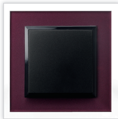
ŁP-1V/50 – IMPRESJA – łącznik jednobiegunowy w kolorze antracyt z ramką szklaną szliwka. Zalety: perfekcyjne dopełnienie nowoczesnego wyposażenia wnętrza.