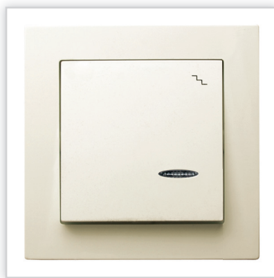
ŁP-3GS/27 – AS – łącznik schodowy z podświetleniem w kolorze ecru. Zalety: proste, nowoczesne kształty i stonowana kolorystyka pozwalają na jej zastosowanie w każdym wnętrzu.