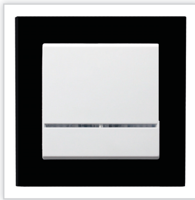
ŁP-1RS/00 – SONATA – łącznik jednobiegunowy z podświetleniem z ramką szklaną czarną. Zalety: seria spełni oczekiwania podążających za najnowszymi trendami, urzeknie swym kształtem i elegancją.