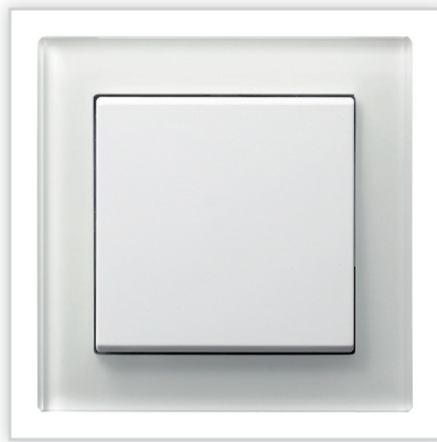
ŁP-1R/00 – SONATA – łącznik jednobiegunowy z ramką szklaną białą. Zalety: idealna kompozycja doskonale pasująca do nowoczesnych wnętrz.